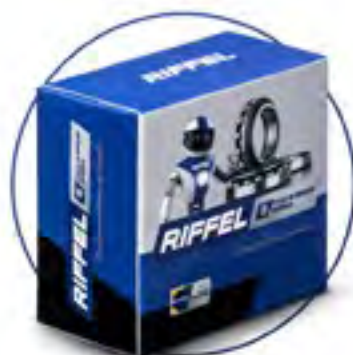
CAIXA DE DIREÇÃO ESFÉRICA