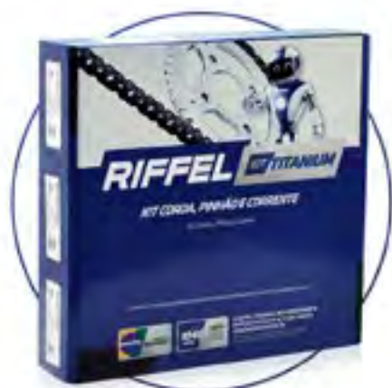
KIT TITANIUM COM CORRENTE