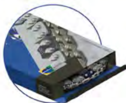
CORRENTE DE COMANDO