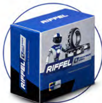
CAIXA DE DIREÇÃO ESFÉRICA