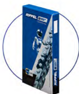
CORRENTE DE COMANDO