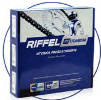
KIT TITANIUM COM CORRENTE