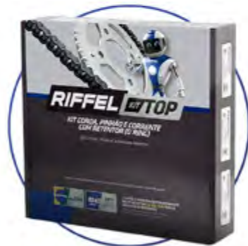
KIT TOP COM CORRENTE O'RING